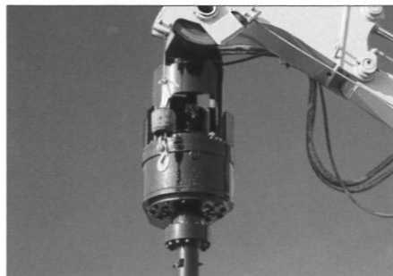
油圧アースオーガ

適用杭: 鋼矢板SP-I, II, III H鋼200H、250H、300H、350H